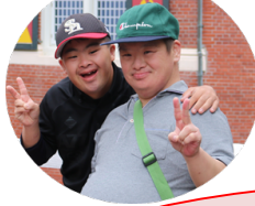
ハウステンボスにて