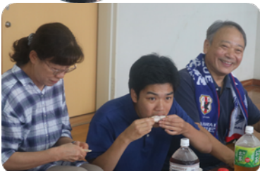
マーケット、お疲れ様!パーベキュー、おいしいね