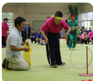
よーくねらって!入ったね~(0)/