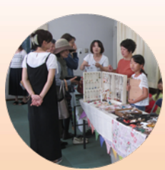
フリーマーケット