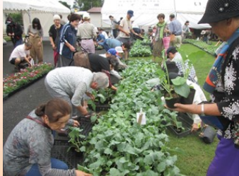
苗物コーナー、たくさんのお客様