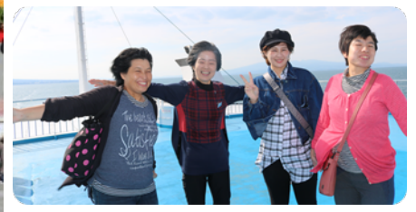
フェリーに乗り、気分はタイタニック☆~♡