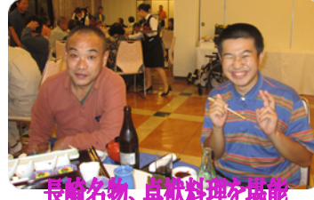
長崎名物、卓袱料理を堪能