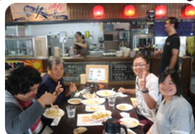
たくさん食べておなかいっぱい!^o^