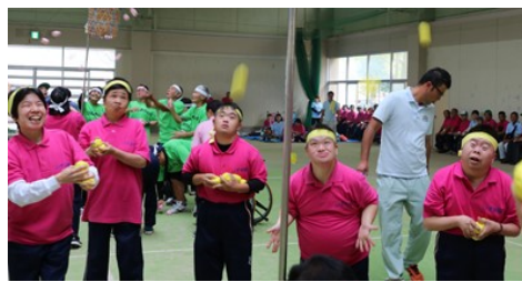
黄色チーム、がんばって!!