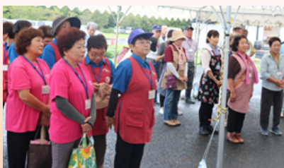
ボランティアの皆様、お疲れ様でした

九月九日、第二十七回虹のマーケットを開催しました。当日は雨の予報もあり、会場のレイアウトを変更しての開催でしたが、たくさんのお客様に足を運んでいただき、大盛況となりました。ボランティアの皆様、ご協力、誠にありがとうございました。