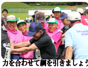
力を合わせて綱を引っ張りましょう

九月十三日、薩摩川内市陸上競技場にて北薩地区ふれあいスポーツ大会が開催され、参加しました。残暑が厳しく暑い一日でしたが、それぞれの競技でがんばりました。