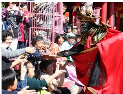
一瞬で仮面の色が変わります