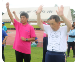
みんなでダンスタイム♪