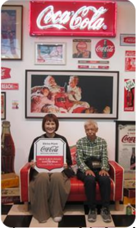
コカ・コーラ大好き～!

七月十二日、えびの、人吉方面へ社会見学に行ってまいりました。えびの市にあるコカコーラ工場を見学し、昼食を食べた後、くまがわ鉄道湯前線を見る、豪華観光列車「田園シンフォニー」で车窗を流れる景色を見ながらプリンを食べ、列車の旅を満喫しました。その後、人吉鉄道ミュージアムではSLが煙を吐きながら走る姿を間近で見ることができました。思い出に残る楽しい一日となりました。