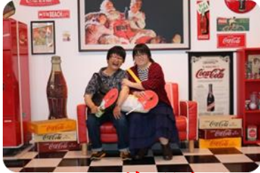
コレクションギャラリーにて