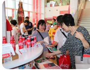
お土産、どれにしましょう?