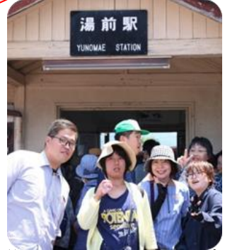
湯前駅より電車に乗り出発です