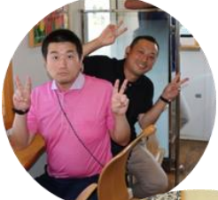
ワクワク!! 電車の旅