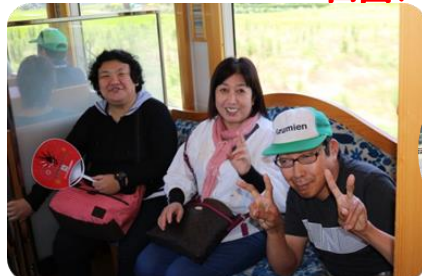
電車に乗るのは久しぶりです