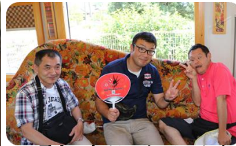
電車の中はとてもおしゃれ!