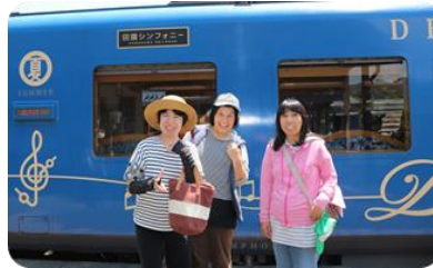
田園シンフォニー♪