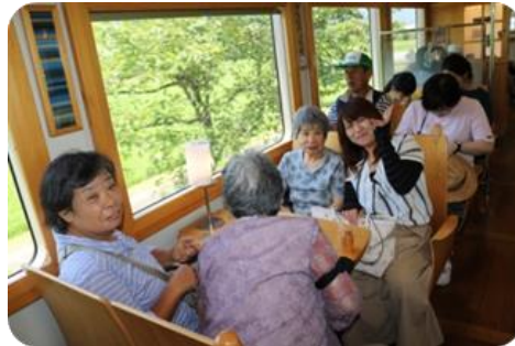
のどかな風景に癒されてまーす(´-)-☆