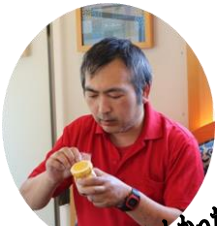
とろけるプリン♡おいしかったです