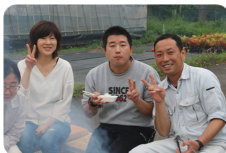
お肉、おいしかったね〜♪

いずみ園の一大イベント、虹のマーケットが終了し、皆で頑張った労をねぎらい、バーベキューをしました。利用者、家族、職員みんなで食べるお肉は最高でした。楽しいひと時を過ごしました。