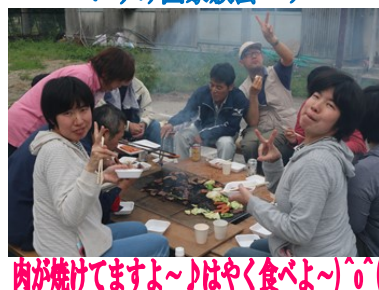
肉が焼けてますよ〜はやく食べよ〜^o^