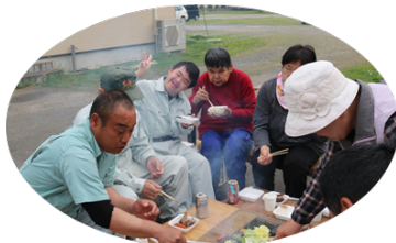
焼くのが忙しくて食べる暇ない♡_<