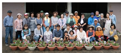
鹿島自治会の皆様

六月十五日鹿島自治会の皆様による、寄せ植え教室を行いました。サルビアやペチュニアなどで夏らしい涼しげな寄せ植えが完成しました。