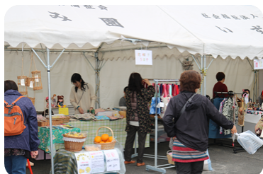
フリーマーケット☆素敵な商品が揃ってます