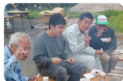
けむりがこっちに来る〜(*_*)