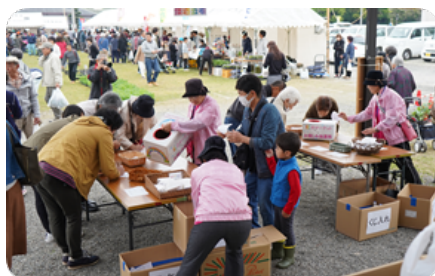
お楽しみ、抽選コーナー♪