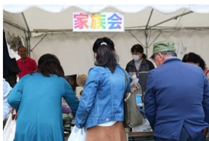
いずみ園家族会バザー