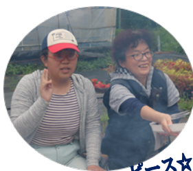
母娘と一緒に、ピース☆