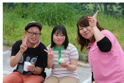
虹のマーケット、お疲れ様でした！