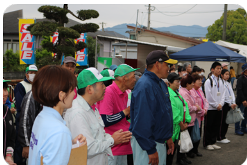
ボランティアの皆様いつもありがとうございます

協賛施設やフリーマーケットでの販売やボランティアの協力もあり、会場は大盛況でした。ありがとうございました。