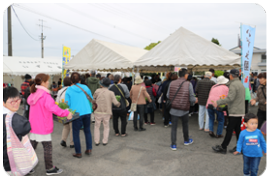
苗物レジ、お客様の行列ができてます