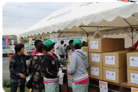
いずみ園の人気商品、木炭です